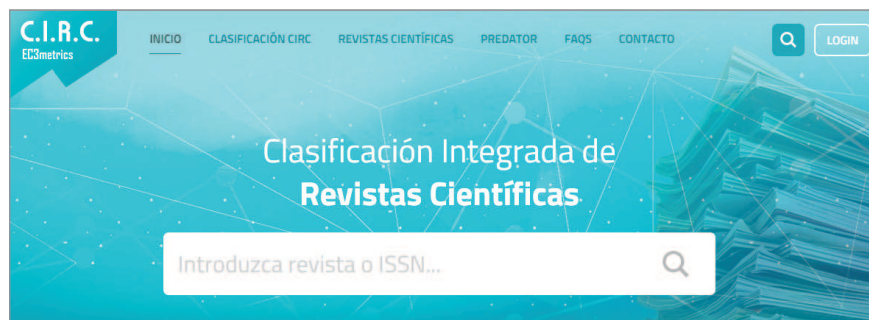
Portada de la web de la Clasificación integrada de revistas científicas (CIRC) http://clasificacioncirc.es

Un aspecto novedoso de esta edición es la presencia de más de 16.000 revistas predator , al objeto de que tanto los investigadores como los evaluadores puedan identificar estas amenazas. Las revistas han sido localizadas a través de los listados de editoriales de Jeffrey Beall (2016).